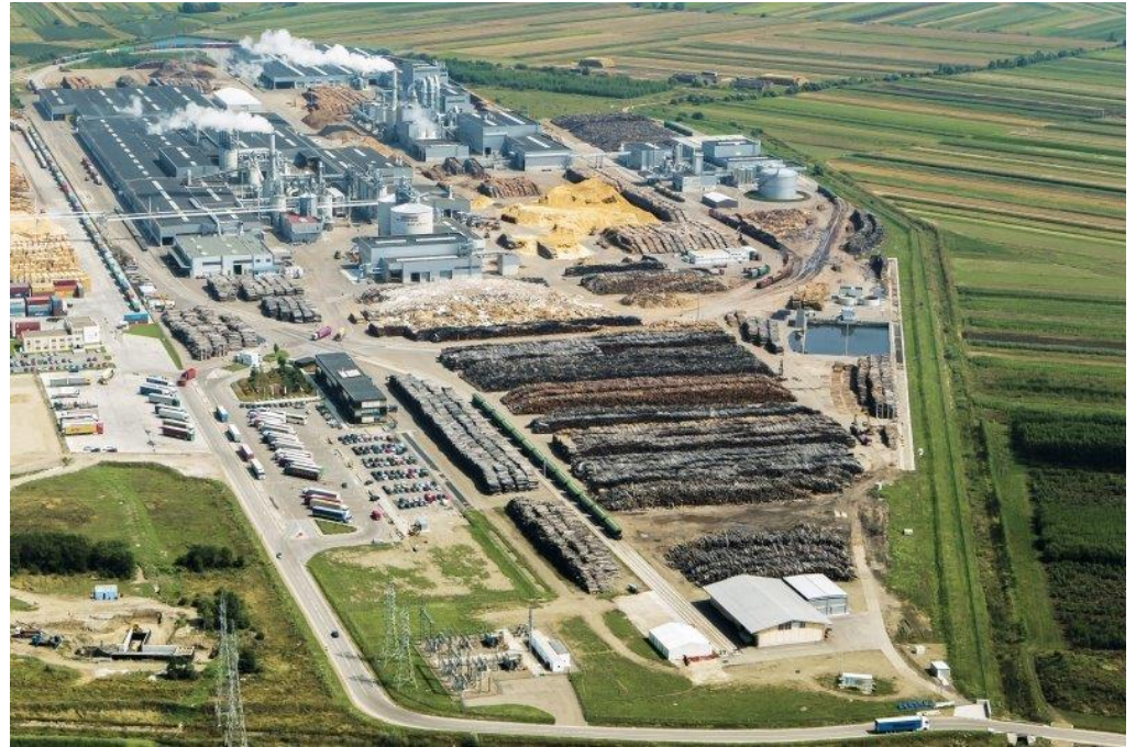
Fabrica EGGER din Rădăuți